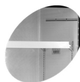
Réglette porte-étiquette de série